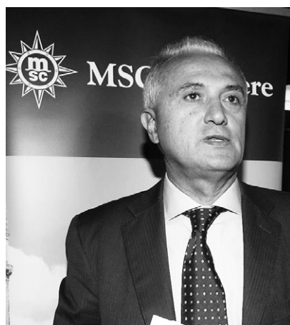
Il libro Mennea autore di «L'oro di Mosca»

Lottiamo - dicono gli organizzatori - per l'estensione dei controlli ematici a quadri sportive anche non agoniste a partire dai 6 anni di età. Al termine della presentazione del libro di Mennea, si raccoglieranno le firme degli intervenuti per portare avanti anche il processo popolare di attivazione legislativa. Saranno conferiti dei riconoscimenti: Attilio Gambardella, vice presidente del Sorrento Calcio una delle prime società a scendere in campo sul passaporto ematico, a due grandi