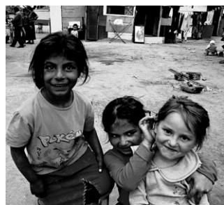
Rom Bambini di un campo